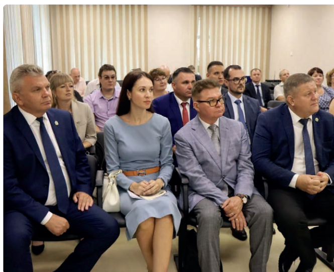
Представители советов муниципальных образований Дальневосточного федерального округа