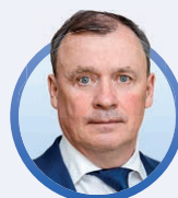
ГЛАВА ЕКАТЕРИНБУРГА АЛЕКСЕЙ ОРЛОВ

Столице Урала – 300 лет. Безусловно, Екатеринбург XVIII века и нынешний – это два разных города. Тогда – форпост империи, завод-крепость. Сегодня – это промышленный и деловой центр России. С традициями и историей, с креативными, свободными и самодостаточными жителями. В 300 лет жизнь только начинается!