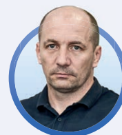
ГЛАВА АДМИНИСТРАЦИИ ЭНЕРГОДАРА (ЗАПОРОЖСКАЯ ОБЛАСТЬ)

Принял участие в стратегической сессии с участием глав муниципальных образований новых регионов РФ в Ростове-на-Дону. Обсуждались долгосрочные приоритеты новых регионов РФ, вопросы развития экономики, городской среды, социальной сферы, требования к городской среде, инженерной и социальной инфраструктуре с учетом планируемых крупных проектов. Уверен, что лучшие идеи обязательно будут реализованы в жизнь и сыграют свою роль в развитии нашего региона и нашего города.