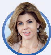
ГЛАВА ЛИПЕЦКА ЕВГЕНИЯ УВАРКИНА

Липецк остается местом, где люди счастливы. Становится все более дружелюбным и комфортным местом для жизни. Наш город – это мир, где люди могут гордиться своим прошлым и стремиться к будущему. 320 лет – серьезная дата. Мы уже многое сделали для развития и процветания Липецка. И я надеюсь, что этот юбилей станет новым этапом в жизни нашего города и началом новых возможностей!