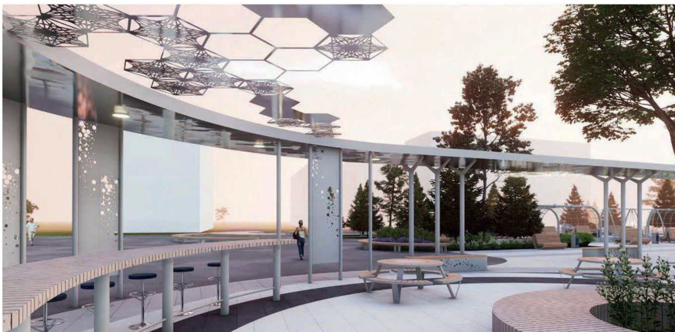
Проект благоустройства Парка в городе Снежное Донецкой области.